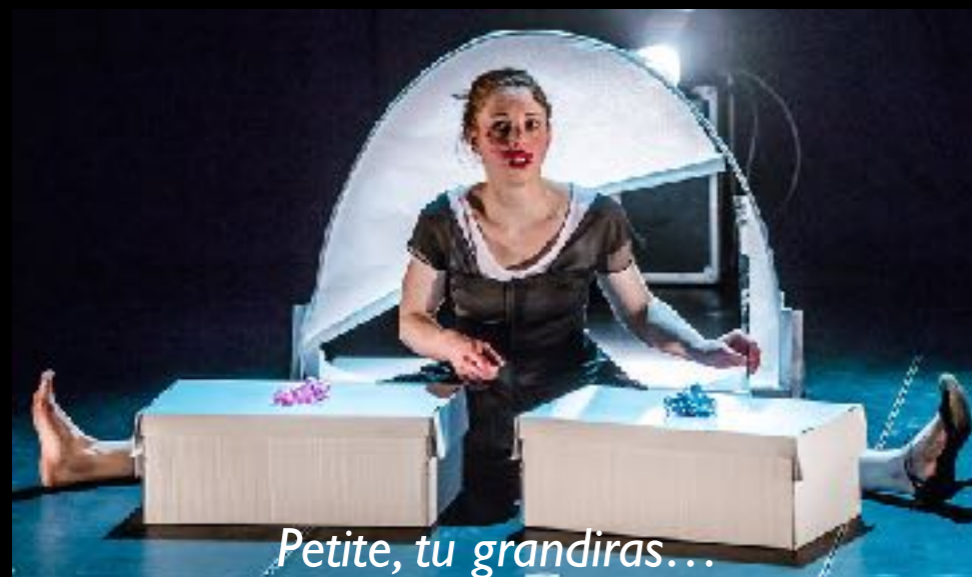
Petite, tu grandiras...