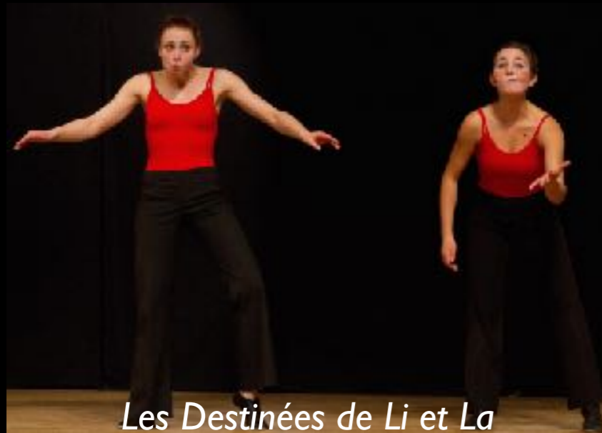
Les Destinées de Li et La

Afin d'investir des espaces où ni le mime, ni la danse ne sont représentés habituellement, des formes plus courtes sont créées, nécessitant peu de moyens techniques. La Compagnie développe également des actions d'enseignement du mime et de la danse contemporaine.